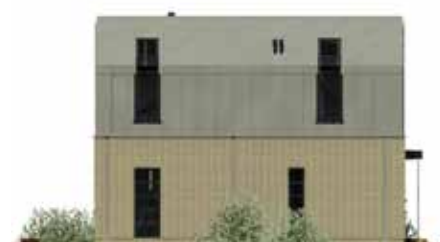
ELEWACJA BOCZNA: TA ŚCIANA MOŻE SĄSIADOWAĆ Z KOLEJNYMI DOMAMI – NIE MA TU WIELU OKIEN, WIĘC MIESZKAŃCY ZACHOWUJĄ INTYMNOŚĆ