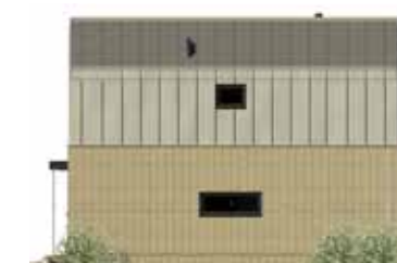
ELEWACJA BOCZNA: Z TEJ STRONY WIDOCZNY JEST PODZIAŁ BUDYNKU NA DWIE KONDYGNACJE RÓŻNIĄCE SIĘ SPOSOBEM WYKOŃCZENIA ŚCIAN