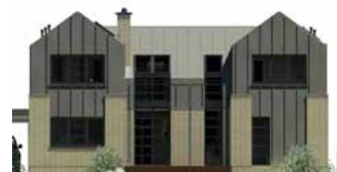
ELEWACJA OGRODOWA: W CZĘŚCI ŚRODKOWEJ NA PARTERZE ZNAJDUJE SIĘ SALON OTWIERAJĄCY SIĘ NA TARAS, PO LEWEJ KUCHNIA, PO PRAWEJ GABINET