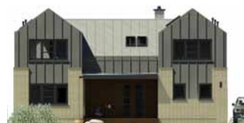
ELEWACJA FRONTOWA: DOM MA NIEMAL SYMETRYCZNY UKŁAD. GŁÓWNE WEJŚCIE ZAPLANOWANO W ŚRODKOWEJ CZĘŚCI, OSŁONIĘTEJ OD DESZCZU I WIATRU